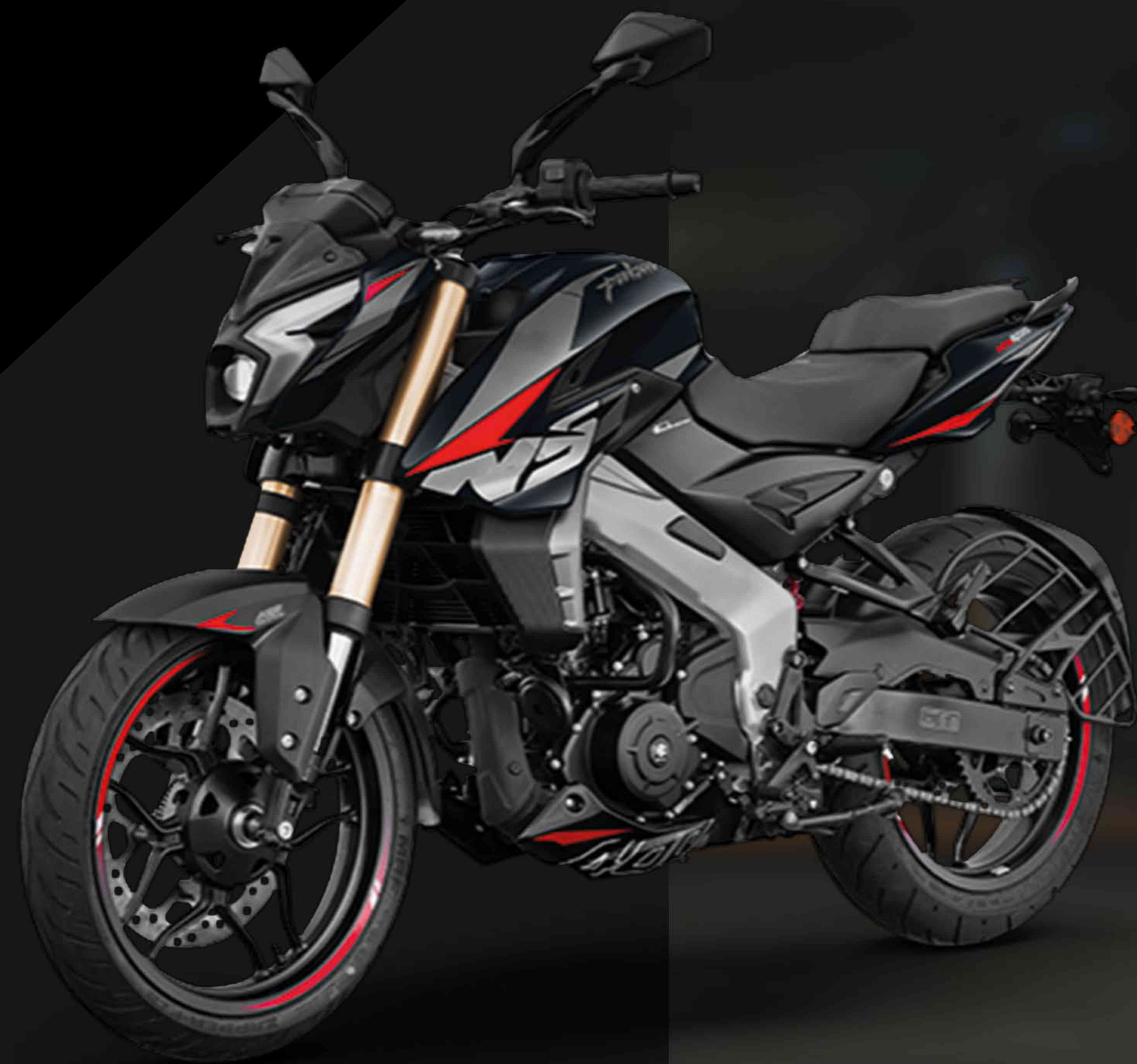
Imagen de referencia. Parrilla lateral (saree guard) no incluida.

6 velocidades, Tecnología ExhaustEC Embrague Multidisco en aceite y antirrebote Velocidad máxima: 173 Km/hr